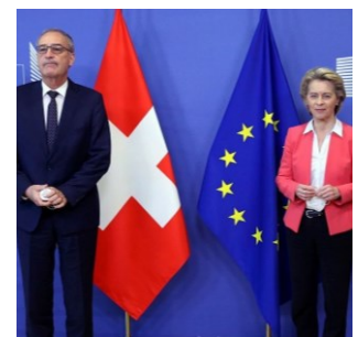
Bundespräsident Guy Parmelin trifft sich mit EU-Kommissionspräsidentin Ursula von der Leyen zu Gesprächen.