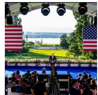
Die Medienkonferenz von US-Präsident Joe Biden mit freiem Blick auf den Genfersee.

«Das, was sich die meisten Schweizer Akteure wünschen, nämlich einfach weitermachen wie bisher, steht in Brüssel mit Sicherheit nicht zur Debatte» (Süddeutsche Zeitung, Deutschland)