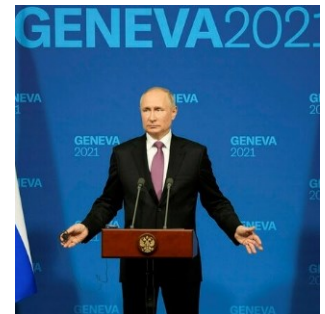
Der russische Präsident Wladimir Putin bei seiner Pressekonferenz in Genf.