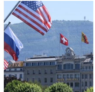
In der Berichterstattung zum Gipfeltreffen finden sich zahlreiche Bilder der Stadt Genf und ihrer Wahrzeichen.

fokus der Berichte liegt klar auf den Protagonisten, Themen und Resultaten des Treffens. Aber in diesem Zusammenhang erhalten auch Genf und die Schweiz die grösste mediale Präsenz der letzten Jahre. Zahlreiche Medien berichten auch ausführlich über Aspekte wie das internationale Genf, die Guten Dienste der Schweiz, ihre Neutralität und ihre Tradition als Gaststaat. Darüber hinaus heben TV-Bilder die touristische Attraktivität Genfs und der Schweiz hervor und veranschaulichen zugleich deren organisatorische Leistungsfähigkeit. Auf grosse mediale Resonanz stösst auch der Empfang der beiden Präsidenten durch Bundespräsident Guy Parmelin. Dessen Bezeichnung von Genf als «ville de paix» wird von vielen Medien übernommen.